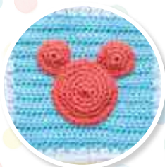
NUMÉRO 1 Le carré Mickey