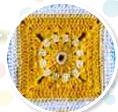
NUMÉRO 6 Le carré Fleur jaune