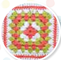
NUMÉRO 3 Le carré Le Livre de la jungle