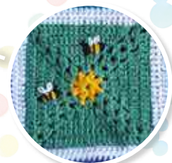
NUMÉRO 4 Le carré Fleur et abeilles Winnie l'ourson