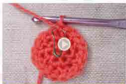
Votre motif à crocheter