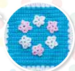
NUMÉRO 2 Le carré Couronne de fleurs de Vaïana

Collection complète en 130 numéros Plaid complet en 100 n° et coussins en 30 n°.