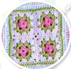
NUMÉRO 5 Le carré Bouquet de roses Raïponce